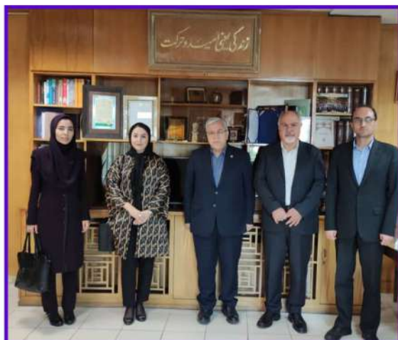
همکاری با کامستک، آکادمی علوم جهان اسلام

رئیس دانشگاه شهید بهشتی، پیشنهاد خود را مبنی بر "تمرکز جشنواره بر اطلاع رسانی گسترده تر" مطرح نمود و در این راستا مقرر گردید طبق فرمایش ایشان، جلسه ای مشترک مابین ارکان جشنواره و رئیس دانشکده رسانه برگزار و از تجارب آنها در زمینه اطلاع رسانی بیشتر این رویداد علمی بهره مند شویم.